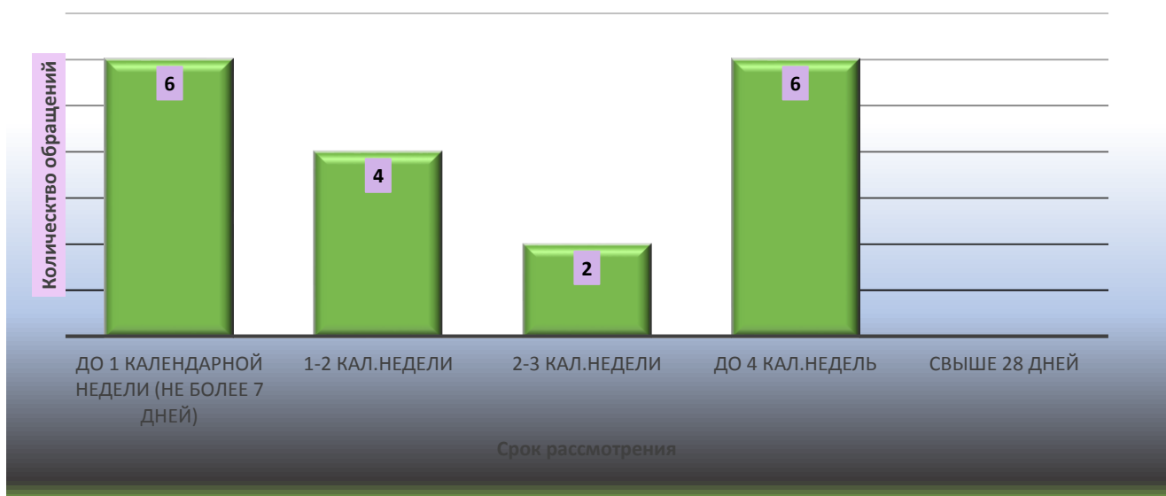
Динамика по срокам рассмотрения обращений

По состоянию на 02 июля 2021 года все обращения граждан, поступившие во II квартале 2021 года, рассмотрены.